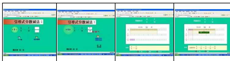
圖表 8 測驗題課程圖示