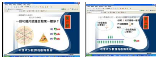
圖表 2 二節課程圖示