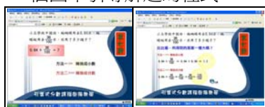
圖表 7 第七節課程圖示

本模組目的異於前面七個單元，主要在於針對學者習較不熟的異分母分數的減法單元，設計出一個圖示引導解題的程式。