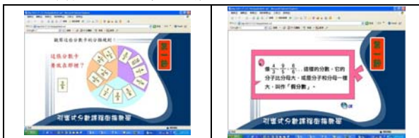
圖表 1 第一節課程圖示

本節的教學重點，期許學習者以能以真分數來描述單位分數內容物為多個物的幾份。透過平分披薩的動畫，讓學習者可以知道連續量佔全部的幾份。接著以口香糖這種離散的情境讓學習者可以知道離散量佔全部的幾份。