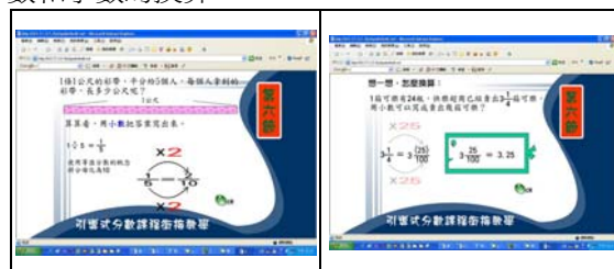
圖表 6 第六節課程圖示