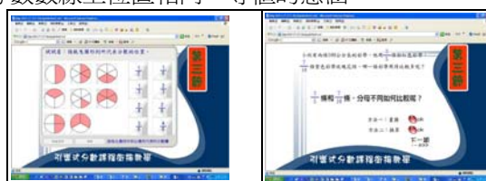
圖表 3 第三節課程圖示

本單元活動利用前面單元的經驗，進一步歸納出等值分數的記法。透過動畫的引導，以描述單位分數內容物為簡單分數數線，來理解等值分數。除了能熟練分數在數線上的表示外，更能理解分數數線上位置相同，等值的意涵。